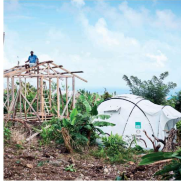
Dominica hurrikanen Irma & Maria vintern 2018