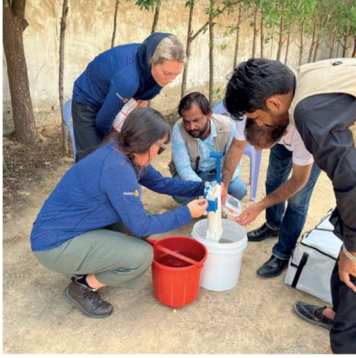
Pakistan monsunöversvämningar hösten 2022