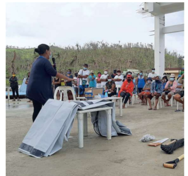
Filippinerna tropisk storm Goni hösten 2020

ShelterBox har levererat skydd och utrustning till ett flertal biståndsprojekt under tiden de varit verksamma i området. På grund av återkommande katastrofer beslöt SB att grunda en filial i Filippinerna och som tillsvidare är den enda. Vi har ett bestående lager av förnödenheter där och några personer som jobbar med att förbättra samhällets förutsättningar att klara sig på de mest utsatta områdena.