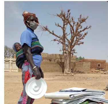
Burkina Faso beväpnade extremistgrupper – vintern 2021

Burkina Faso har varit i internt kaos redan i flera år. Familjer rånas och jagas bort från sina hembyar. Klimatförändringarna har inte heller gjort det lättare att leva i Sahels ökenområden. Det som pågår här är en av världens glömda kriser. ShelterBox har levererat hjälp via flera projekt till områden med svåra förhållandena.