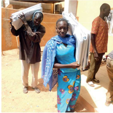
Burkina Faso beväpnade extremistgrupper – sommaren 2020