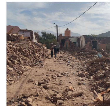
Marocko jordbävning – hösten 2023

I Turkiet var ShelterBox en av de få internationella organisationer, som med hjälp och stöd av rotarianer fick licens för hjälparbete.