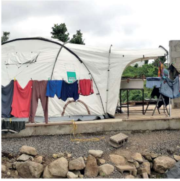
Dominica hurrikanen Irma & Maria vintern 2018