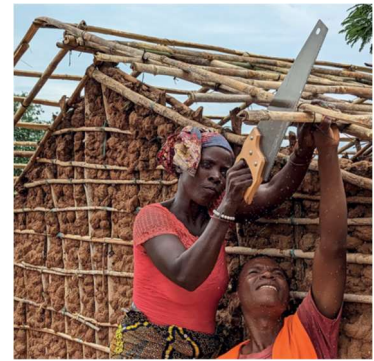
Mocambique – översvämning och våld i Cabo Delgado – sommaren 2023

De som har förlorat sitt hem på grund av konflikter under åren 2022 - 23 har varit många. Deras behov har varit de viktigaste målen för skydd och förnödenheter. Sedan det fullskaliga krigets början i Ukraina har man hjälpt över 120 000 människor med reparations- och vinterutrustning. 2022 hjälpte ShelterBox flyktingar utomlands, särskilt i Moldavien.