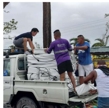
Filippinerna tropisk storm Rai vintern 2021 - 2022