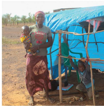
Burkina Faso beväpnade extremistgrupper – våren 2022