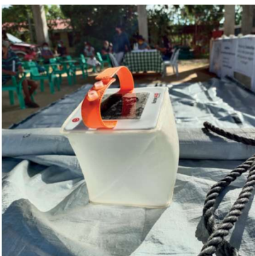
Filippinerna tropisk storm Rai vintern 2021 - 2022

ShelterBox har levererat skydd och utrustning till ett flertal biståndsprojekt under tiden de varit verksamma i området. På grund av återkommande katastrofer beslöt SB att grunda en filial i Filippinerna och som tillsvidare är den enda. Vi har ett bestående lager av förnödenheter där och några personer som jobbar med att förbättra samhällets förutsättningar att klara sig på de mest utsatta områdena.