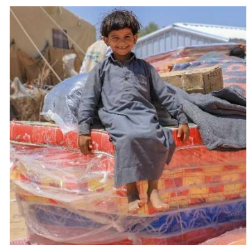
Jemen konflikt – våren 2023

Förutom våld har stora översvämningar plågat en del av Mocambique. ShelterBox har tillsammans med samarbetspartner varit på plats och förutom att tillhandahålla material också hjälpt till att förebygga skador av monsunregn. I Jemen pågår inbördeskrig och där måste de som förlorat sina hem leva länge i tillfälliga skydd. ShelterBox finansierar där enkla tillfälliga skydd.