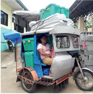
Filippinerna tropisk storm Tisoy våren 2019