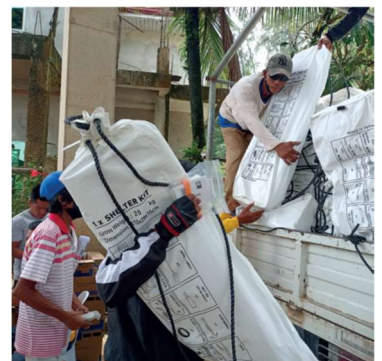
Filippinerna tropisk storm Rai vintern 2021 - 2022

Året 2023 var tämligen lugnt på det här området, bara några försändelser av nödskydd och material sköttes lokalt (SB Operations Philippines). Hela tiden har landets Rotaryklubbar varit en viktig motor och frivillig kraft i biståndsarbetet.