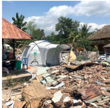
Indonesien jordbävning och tsunami – våren 2018