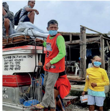
Filippinerna tropisk storm Goni hösten 2020