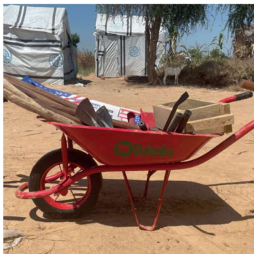
Kamerun – grannlandets beväpnade extremistgrupper hösten 2022

Burkina Faso har varit i internt kaos redan i flera år. Familjer rånas och jagas bort från sina hembyar. Klimatförändringarna har inte heller gjort det lättare att leva i Sahels ökenområden. Det som pågår här är en av världens glömda kriser. ShelterBox har levererat hjälp via flera projekt till områden med svåra förhållandena.