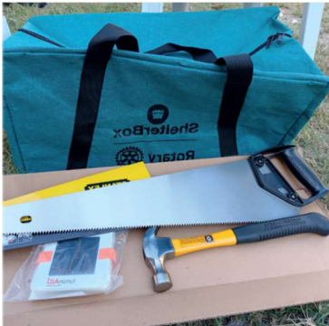
Filippinerna taifun Rai vintern 2021 – 2022

I sydöstra Asiens länder, i Indien delvis och i östra delarna av Pakistan, i Bangladesh Malaysia, Thailand, Myanmar är översvämningar en återkommande plåga. I de folkrika länderna på detta riskområde är behoven av hjälp årligen återkommande. Länderna har förbättrat sin egen beredskap men i t.ex. Pakistan skulle de som förlorade sina hem hösten 2022 pga. stora översvämningar fortfarande år 2024 sakna tillräckligt skydd om inte ShelterBox hade bistått med projekt 2023. Också här bestod hjälpen av tillfälliga provisoriska hem, byggda av lokala krafter.