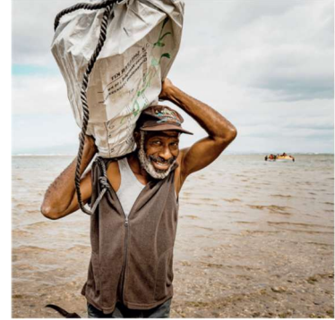
Vanuatu cyklon Harold hösten 2020

Öarna och småstaterna har gång på gång hamnat på rutter för orkaner som uppstår på Atlanten. På en del av de här öarna är byggnaderna kläna och utsatta för skador. ShelterBox har haft flera biståndsprojekt på olika öar och de små staterna. Haiti är ett kapitel för sig.