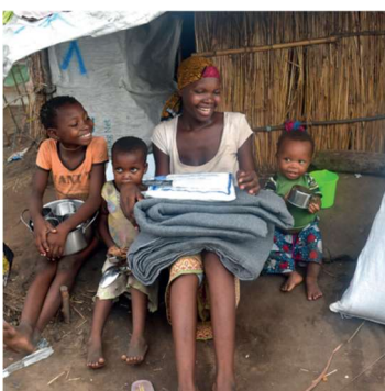
Mocambique våld Cabo Delgado – vintern 2022

En del av Mocambique är typiska mål för leveranser av en mångfald av nödskydd och hemlösöre.