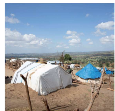
Etiopien konflikt Tigray årsskiftet 2022 - 23

I norra delen av Etiopien, närmast i provinsen Tigray har det uppstått problematiska situationer som tvingat familjer att lämna sina hem. Å ena sidan strider och våld av rebeller som kräver självständighet för området och å andra sidan exceptionellt långvarig torka som följts av häftiga regn vilka har plågat Afrika Horns närområden. Samarbetspartner i arbetet med distribution av hjälpsändningar är FN:s anslutsorganisation IOM.