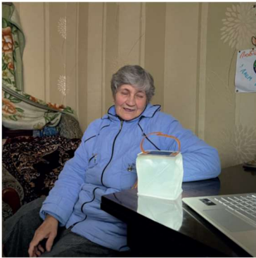
Ukraina krig – vintern 2022 – 2023

De små öarna i Stilla havet hamnar då och då på taifunernas rutter. Biståndsprojekten är tämligen små.