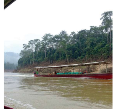
Malaysia monsunöversvämningar hösten 2015

I sydöstra Asiens länder, i Indien delvis och i östra delarna av Pakistan, i Bangladesh Malaysia, Thailand, Myanmar är översvämningar en återkommande plåga. I de folkrika länderna på detta riskområde är behoven av hjälp årligen återkommande. Länderna har förbättrat sin egen beredskap men i t.ex. Pakistan skulle de som förlorade sina hem hösten 2022 pga. stora översvämningar fortfarande år 2024 sakna tillräckligt skydd om inte ShelterBox hade bistått med projekt 2023. Också här bestod hjälpen av tillfälliga provisoriska hem, byggda av lokala krafter.