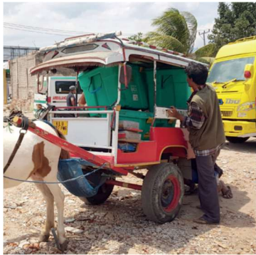
Indonesien jordbävning och tsunami – våren 2018