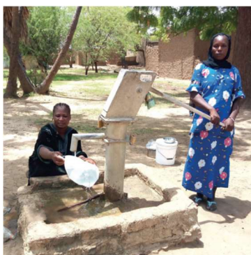
Tchad konflikt – hösten 2018

I Marocko spelade det lokala Rotary-distriktet med sitt nätverk lika viktig roll som rotarianer i Turkiet i att öppna dörrar och få kontakter. De valde en partner att leverera hjälpen och var med i arbetet ända till slutet.