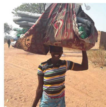
Tchad konflikt – hösten 2018