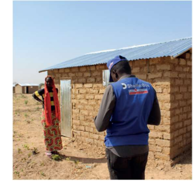
Kamerun – grannlandets beväpnade extremistgrupper vintern 2023

I norra delen av Kamerun finns bl.a. Minawaons väldiga flyktingläger, dit nästan 100 000 människor har flytt, speciellt från Nigeria. Där verkar bara några få hjälporganisationer. Nya familjer med behov av skydd anländer dagligen på flykt undan Boko Harams våld. SB har också där byggt tillfälliga skydd (se bilden till höger) i vilka familjerna kommer att bo flera år.