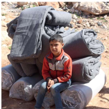
Turkiet jordbävning – vintern 2023

I gränsområden mellan Turkiet och Syrien skedde en jordbävning. I båda länderna hjälpte ShelterBox dem som förlorat sina hem.