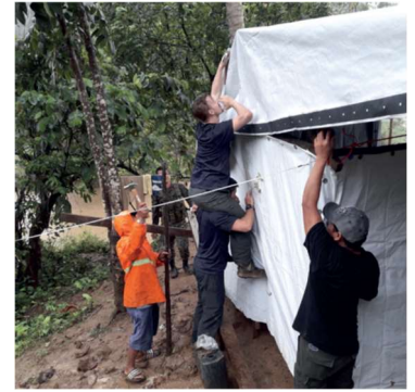
Filippinerna tropisk storm Tisoy våren 2019

I Filippinerna förekommer naturkatastrofer ännu oftare än i Indonesien. Landet är utsatt framför allt för orkaner som kommer från Stilla havet. Under ett " normalt " år strandar flera av dem på olika öar. Skadorna kan vara betydande.