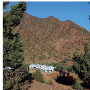
Marocko jordbävning – hösten 2023