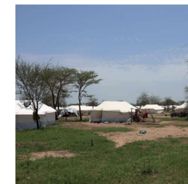
Tchad - grannlandet Sudans konflikt – hösten 2023

I Tchad har ShelterBox deltagit i leveranser av katastrofskydd redan en längre tid. Bilderna är från hjälpprojektet 2018. Orsaken till behovet är extrem islamistiska Boko Haram som är verksam i fyra olika länder. De driver flyktingar till Kamerun och förorsakar interna flyktingströmmar i Nigeria, Niger och västra delen av Tchad. Flyktinglägren i landets östra delar är nya. Dit flyr man torka och våld från grannlandet Sudan (2023).