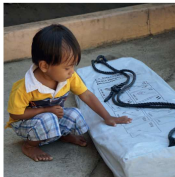
Filippinerna taifun Manghut hösten 2018

Om hjälpbehov och -projekt i Filippinerna finns mera beskrivet på sidan 3. I bildmaterialet finns mycket om olika varor och situationer som också passar på Memo-kortet. Ovan några detaljer till.