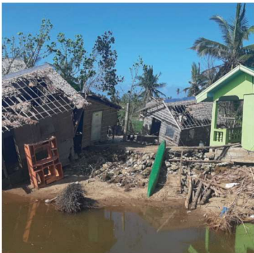
Filippinerna tropisk storm Tisoy våren 2019

I Filippinerna förekommer naturkatastrofer ännu oftare än i Indonesien. Landet är utsatt framför allt för orkaner som kommer från Stilla havet. Under ett " normalt " år strandar flera av dem på olika öar. Skadorna kan vara betydande.