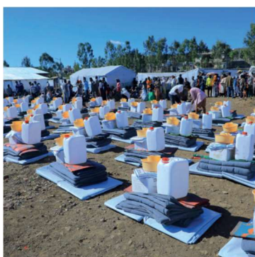
Etiopien konflikt Tigray sommaren 2023

I norra delen av Kamerun finns bl.a. Minawaons väldiga flyktingläger, dit nästan 100 000 människor har flytt, speciellt från Nigeria. Där verkar bara några få hjälporganisationer. Nya familjer med behov av skydd anländer dagligen på flykt undan Boko Harams våld. SB har också där byggt tillfälliga skydd (se bilden till höger) i vilka familjerna kommer att bo flera år.