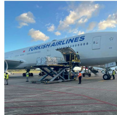
Turkiet jordbävning – vintern 2023

Indonesien är ett område som är utsatt för många olika typer av naturkatastrofer. Bilderna är från skador förorsakade av en jordbävning under vatten och påföljande tsunamivåg och när hjälp ges till dem som förlorat sina hem på grund av detta.