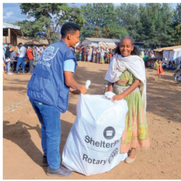
Etiopien konflikt Tigray sommaren 2023