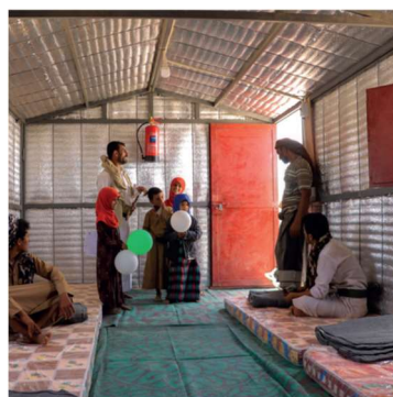
Jemen konflikt – våren 2023