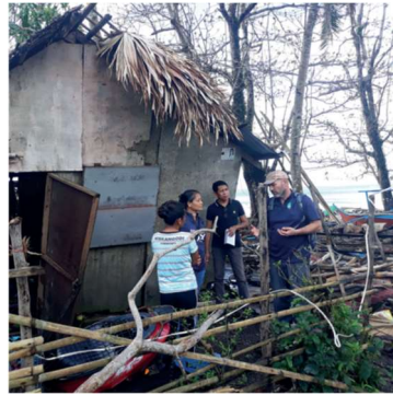
Filippinerna tropisk storm Tisoy våren 2019