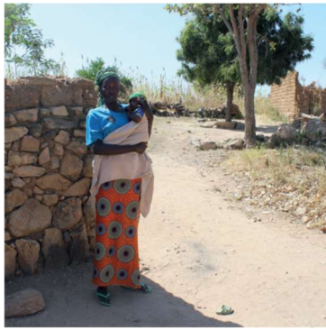
Kamerun – grannlandets beväpnade extremistgrupper hösten 2022