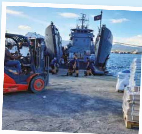
Skyddskitt lastas på en båt för att nå familjer i Filippinerna som återhämtar sig efter tyfonen Goni.

Under coronavirus-eran har utmaningarna med logistiken kring hjälpinsatser globalt blivit större än någonsin. Låt oss titta lite närmare på logistikarbetet för ShelterBox och hur våra transporter till de familjer som behöver hjälpen mest går till.