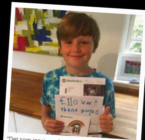
"Det som inspirerade mig var att många människor världen över inte har samma privilegier som vi så jag ville hjälpa till och göra några familjer i en svår situation lyckliga." - James

Jeane visar stolt upp den solcellslampa hon fick från ShelterBox efter att hennes hem skadades av cyklonen