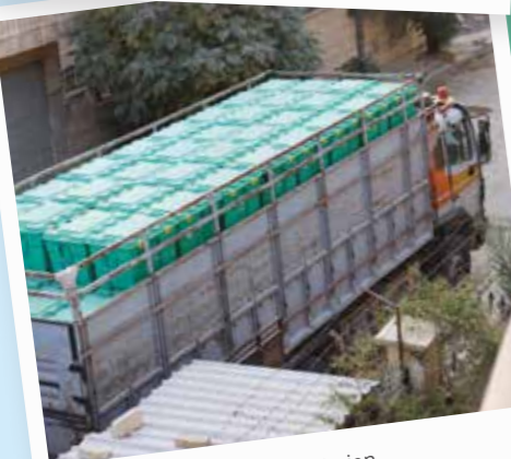
ShelterBoxar ankommer till Syrien.