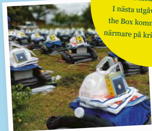
Socialt distanserad hjälpdistribution till 2 220 familjer i Etiopien.