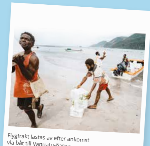
Flygfrakt lastas av efter ankomst via båt till Vanuatu-öarna