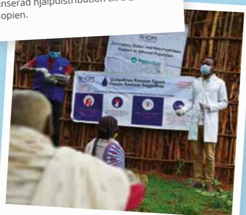
Under distributionerna fanns det coronavirus-meddelanden och en hälsoexpert på plats för att förklara hur man motverkar infektioner.

Tidigare händelser i Etiopien har komplicerat vår förmåga att bidra med hjälpinsatser. I nästa utgåva av Beyond the Box kommer vi att titta närmare på krisen i Etiopien.