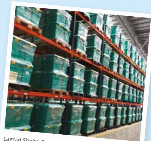
Lagrad ShelterBox-hjälp i ett Panama-lager redo att gå till Honduras.

En av dessa förändringar var att introducera lagercentra i vår leveranskedja. Detta är den term vi använder för att lagra hjälpartiklar på strategiska platser runtom i världen. Det gör det enklare och billigare att flytta hjälpen till de platser där den behövs vid respons på katastrofer.