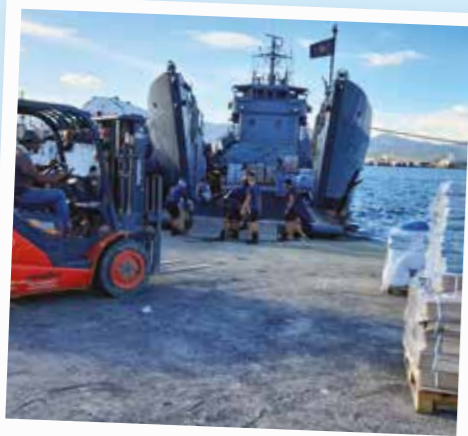
Taifuuni Gonista kärsineille perheille tarkoitettuja hätäsuojapaketteja lastataan laivaan Filippiineillä.

Avun kuljettaminen eri puolille maailmaa on koronaviruspandemian aikana haasteellisempaa kuin koskaan aiemmin. Sukella kanssamme ShelterBoxin logistiikan maailmaan ja lue, kuinka saamme avun perille sitä eniten tarvitseville perheille.