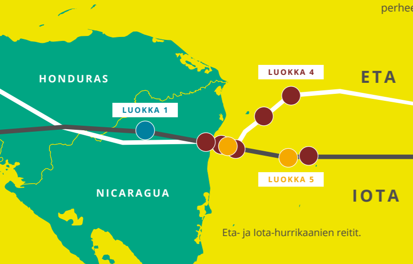
Eta- ja Iota-hurrikaanien reitit.