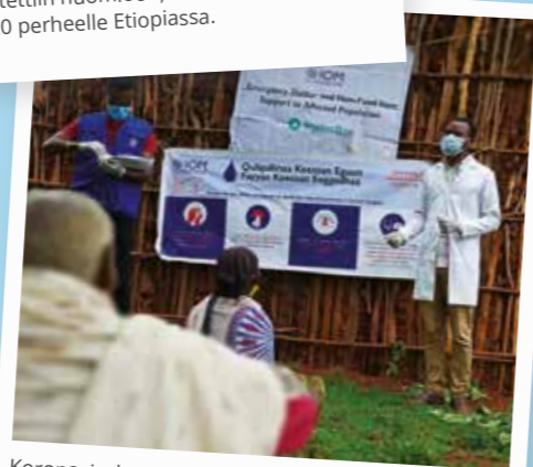
Koronaviruksesta ja siihen liittyvistä toimenpiteistä tiedotettiin julisteiden ja kylttien avulla, ja avustustarvikkeiden jakelupisteessä oli lisäksi paikalla terveydenhuollon ammattilainen, joka kertoi tartuntojen ehkäisemisestä.

Etiopian viimeaikaiset tapahtumat ovat vaikuttaneet kykyymme toimia maassa. Tutustumme Etiopian kriisiin tarkemmin Beyond the Box -uutiskirjeen seuraavassa numerossa