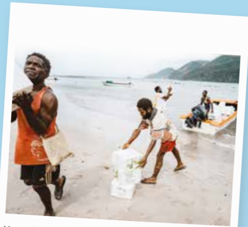
Veneellä Vanuatun saarille saapuneita avustustarvikkeita kuljetetaan maihin

Käytämme tyypillisesti merirahtia aina, kun se on mahdollista. Merirahti on lentorahtia kustannustehokkaampi vaihtoehto, mutta kuljetusajat ovat huomattavasti pidempiä. Se on hyvä vaihtoehto, jos kyseessä on Etiopian tilanteen kaltainen pidempään jatkunut kriisi, johon liittyy useita pidemmällä aikavälillä toteutettavia avustusprojekteja. Käytämme lentorahtia, jos kyseessä on odottamaton katastrofi, johon on kyettävä vastaamaan nopeasti.