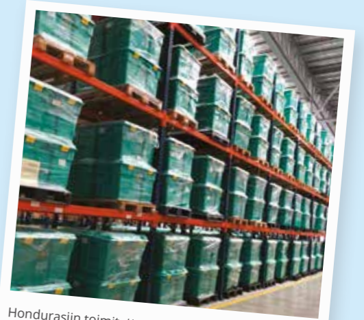
Hondurasiin toimitettavat avustustarvikkeet odottavat kuljetusta ShelterBoxin Panaman varastolla.

Eräs tekemistämme muutoksista on ollut eri puolille maailmaa sijoitettujen paikallisten varastojen perustaminen osaksi toimitusketjuamme. Näitä varastoja käytetään avustustarvikkeiden varastointiin strategisiin sijainteihin eri puolilla maailmaa. Avun toimittaminen sitä tarvitseville onnistuu näiden varastojen ansiosta nopeammin ja edullisemmin katastrofin iskiessä.