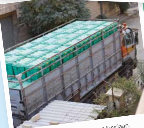
ShelterBox-laatikoida saapumassa Syyriaan.