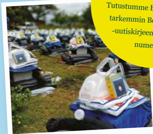
Turvavälit otettiin huomioon, kun avustustarvikkeita jaettiin 2 220 perheelle Etiopiassa.