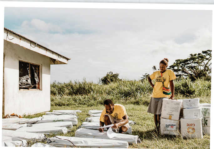
Skyddskitt sorteras i Vanuatu

Vi har fortfarande kunnat genomföra alla dessa viktiga processer, men alla har gjorts med partnerorganisationer. Där vissa organisationer tillfälligtvis var tvungna att stoppa sin verksamhet för att utarbeta sin plan, kunde vi fortsätta att skicka skyddskitt och rädda liv.