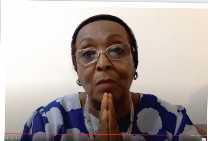
Edna Adan Ismail, en av våra bokklubbsförfattare talar till våra medlemmar