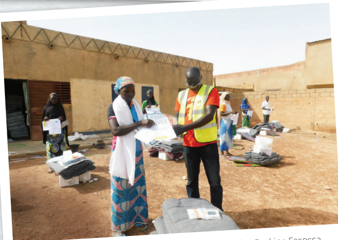
Kumppaniemme toteuttamaa avustustarvikkeiden jakelua Burkina Fasossa.