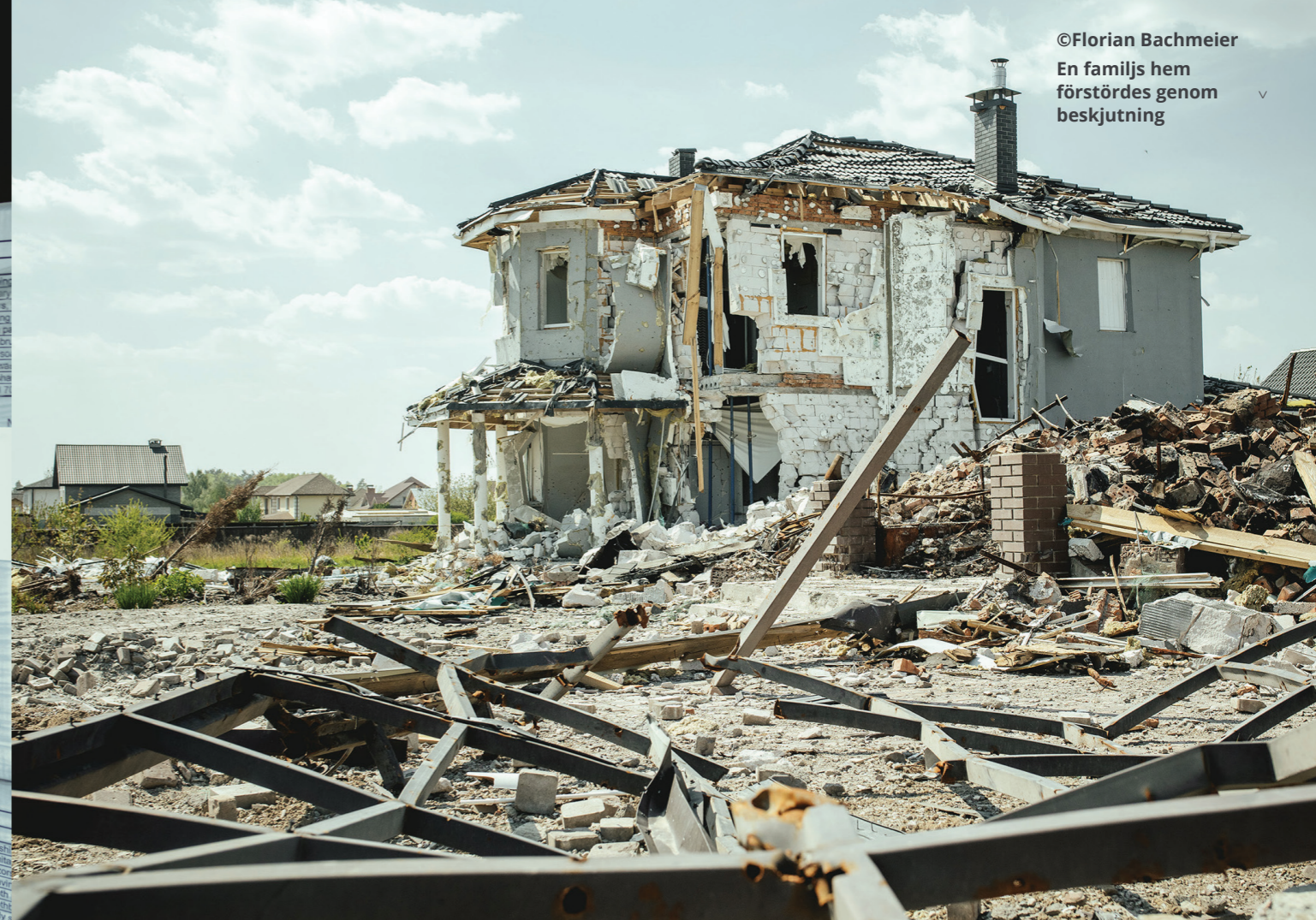
En familjs hem förstördes genom beskjutning