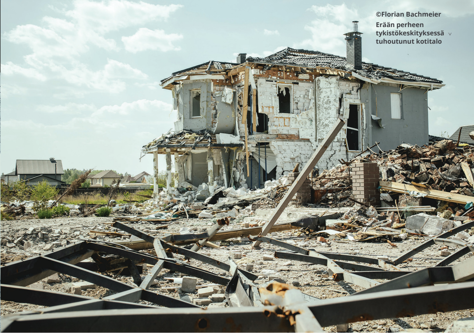
Erään perheen tykistökeskityksessä tuhoutunut kotitalo