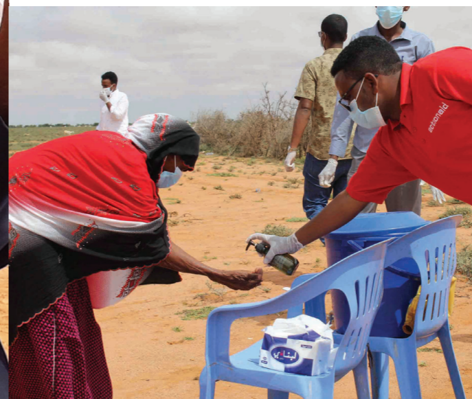
∨ Handrengöring under distribution i Somaliland