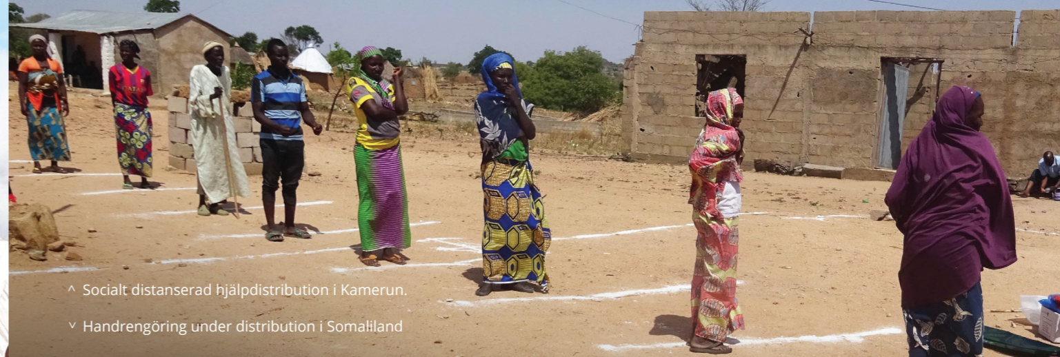
^ Socialt distanserad hjälpdistribution i Kamerun.

De flesta länder har också infört restriktioner kring rörelser och större folksamlingar för att försöka förhindra spridningen av coronavirus.