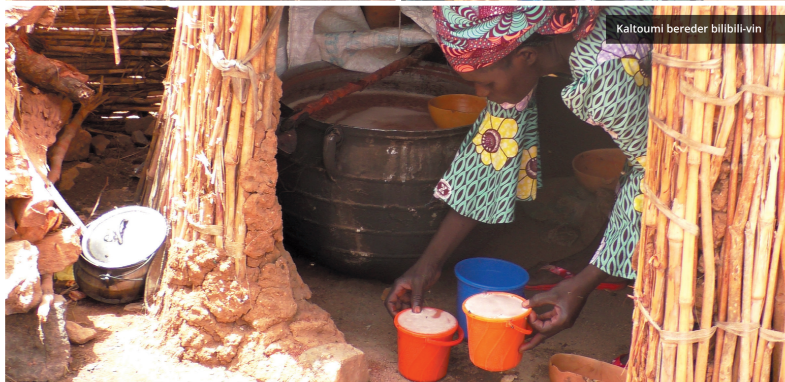
Kaltoumi bereder bilibili-vin