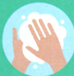
Pesuvadit ja saippuaa

rek.nro 209.939 Y-tunnus 2557466-8 kotipaikka Lahti osoite Kaiturintie 11 16800 Hämeenkoski